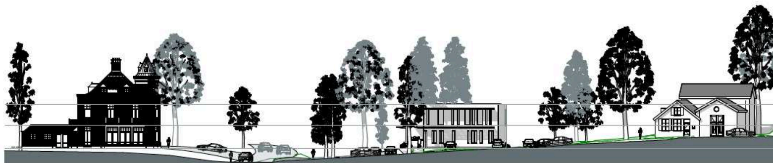
Ter Hoffsteedweg 2