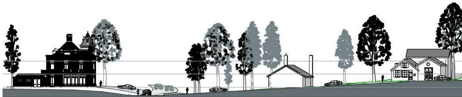
Ter Hoffsteedweg 2