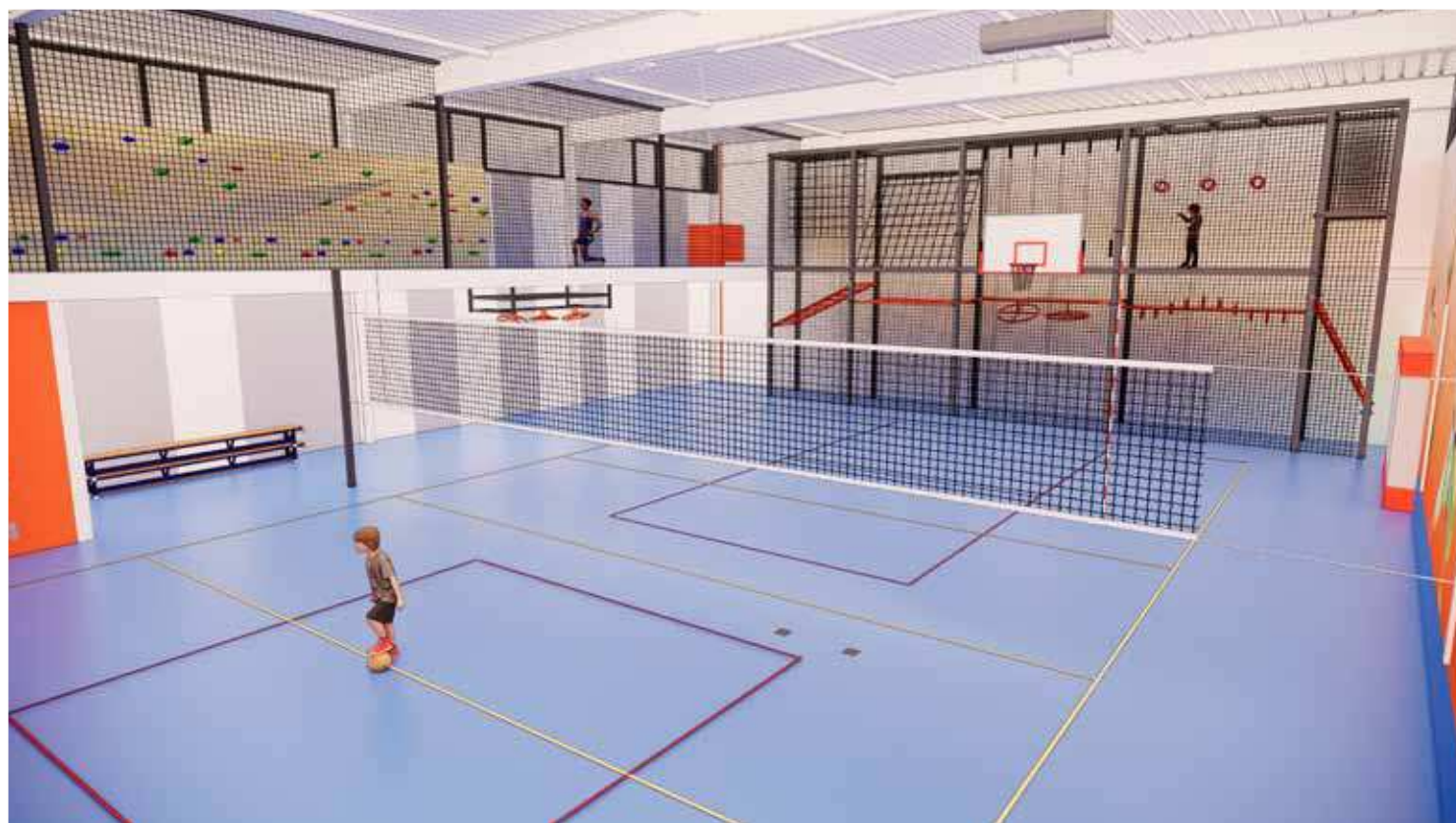
impressies van enkele mogelijke inrichtingen van De Nieuwe Gymzaal de definitieve indeling en inrichting komt tot stand in samenspraak met gebruikers