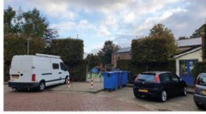
Zicht op de school