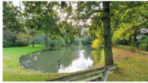
Zicht op de vijver