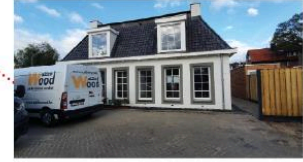
Beeld van het nieuwe koetshuis