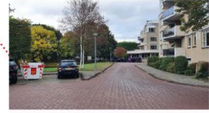
Zicht op het park

In 2008 is door de gemeente Bloemendaal een perceel gekocht. Dit perceel stond eerder bekend onder de naam 'Landje van Riessen' en zal in dit document 'Bispinckpark Noord' worden genoemd (BPN). Het doel van de aankoop van dit 1.080 m 2 grote perceel was het bouwen van een gymzaal voor De Josephschool, maar dit is nooit tot ontwikkeling gekomen. BPN ligt inmiddels al jaren braak.