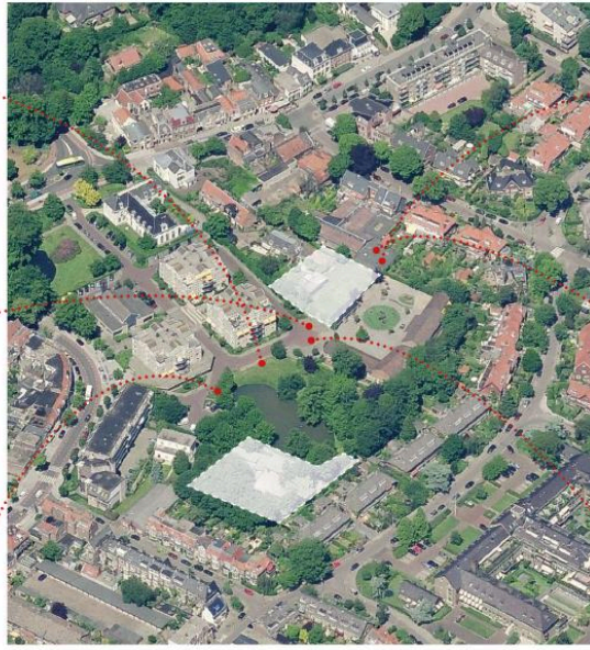
Vogelvlucht van de locaties met straatbeelden.