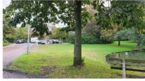
Zicht op het park