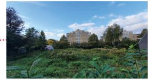
Zicht op BPN