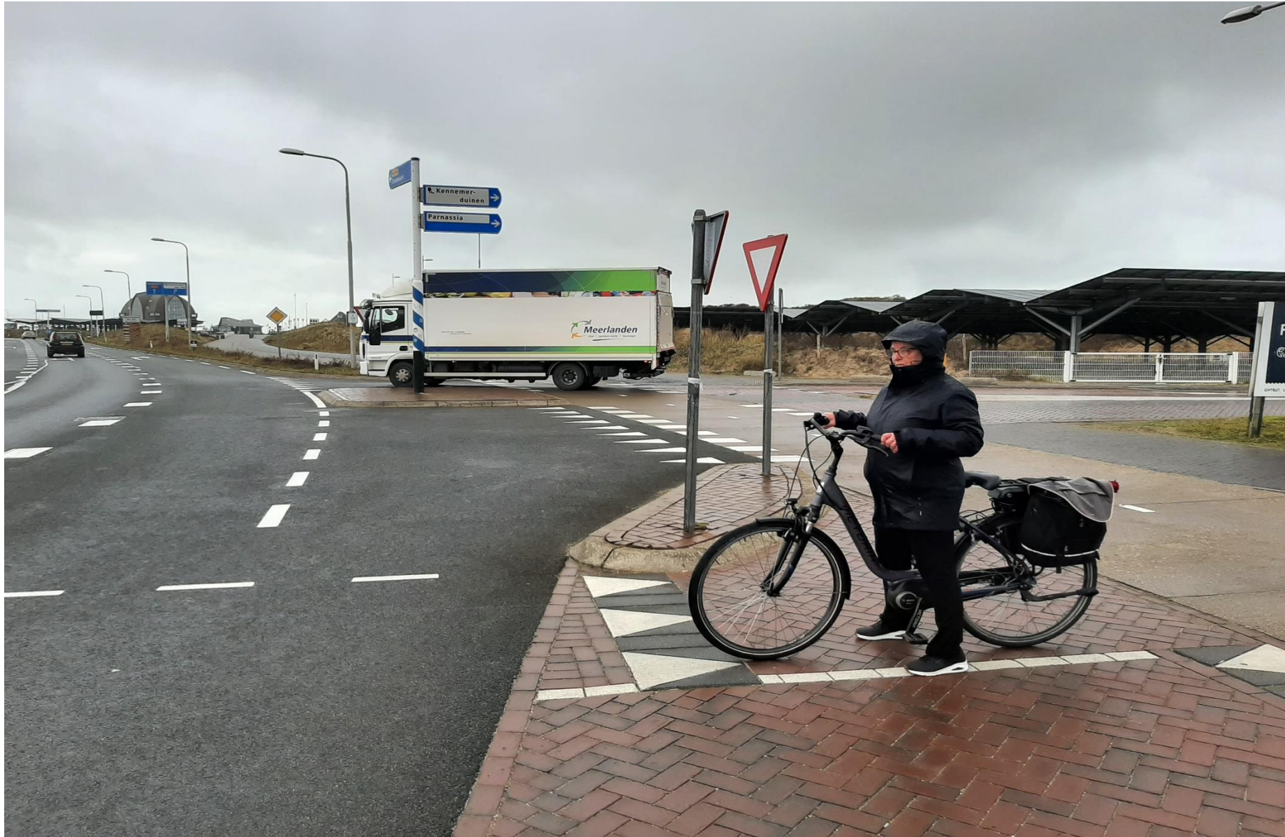
Het verkeer dat van Parnassia komt mag alleen maar rechtsaf slaan richting Zandvoort of om verderop te keren. Dat verkeer heeft geen invloed op de fietsers die oversteken, maar het leidt wel af, daar er hier verkeer van alle kanten komt, zoals bij foto 1 al aangegeven.