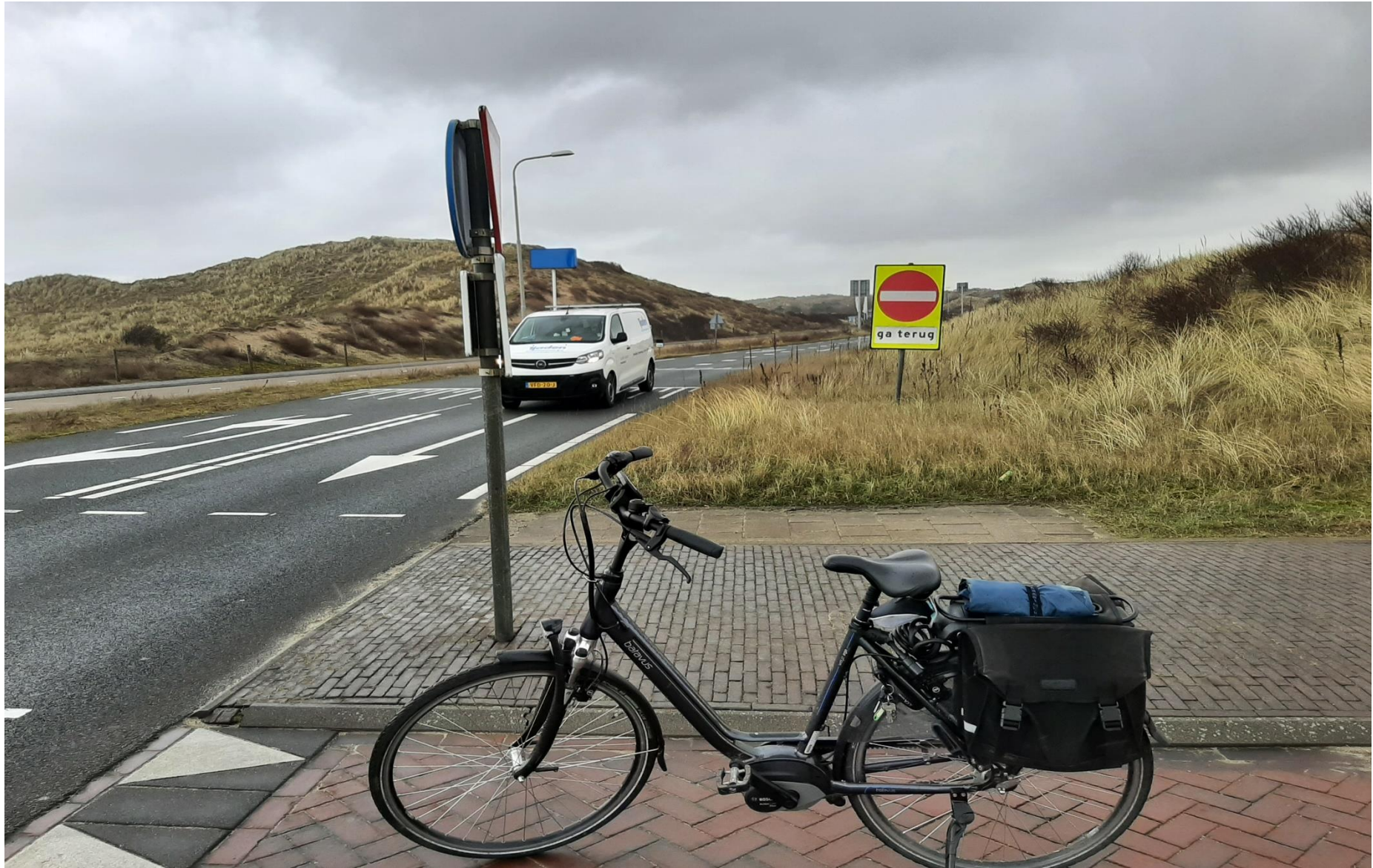
Het aandachtspunt bij de vorenstaande foto wordt hier in beeld gebracht.