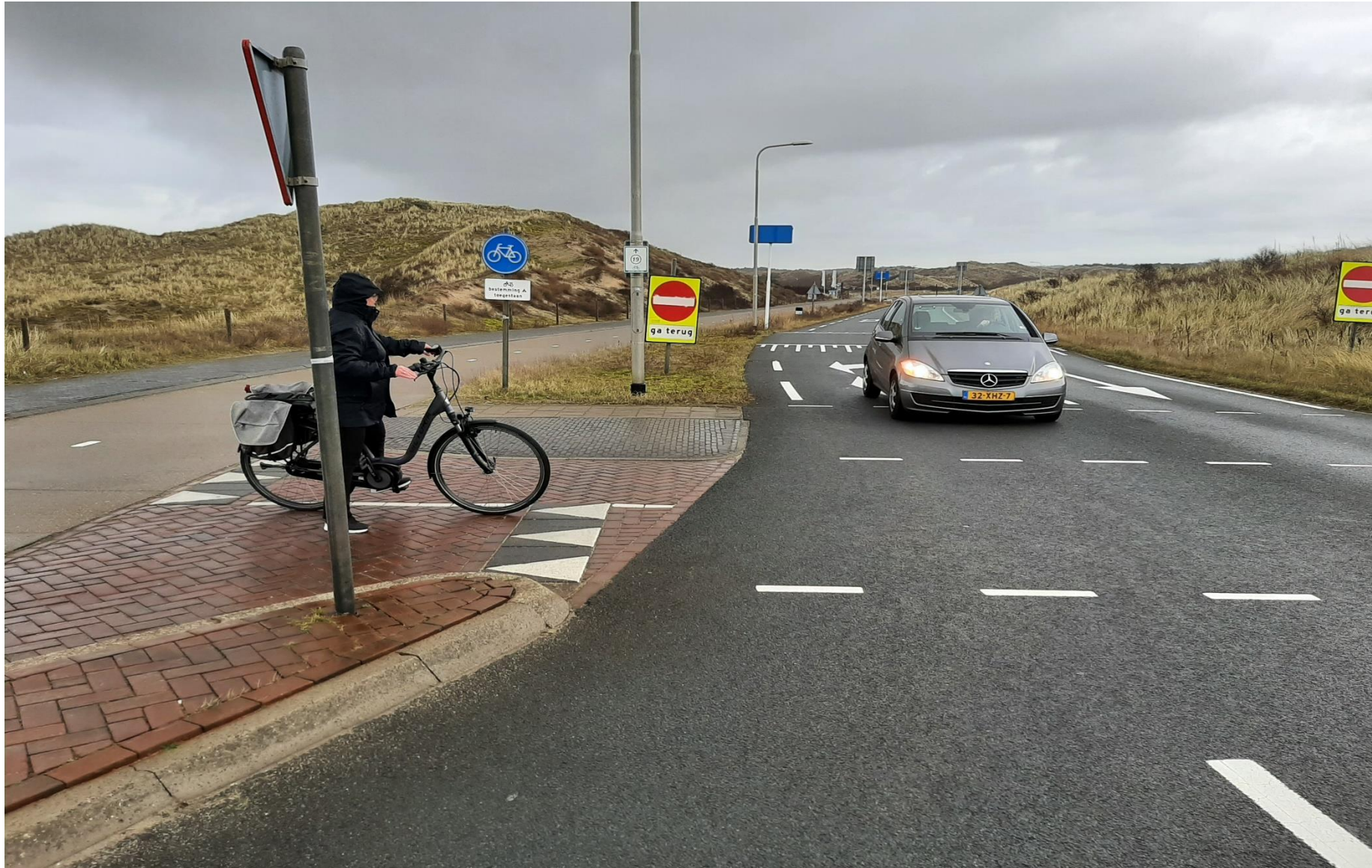
Het verkeersbord, de lichtmast en het 'Ga terug' bord beperken hier enigszins het zicht.