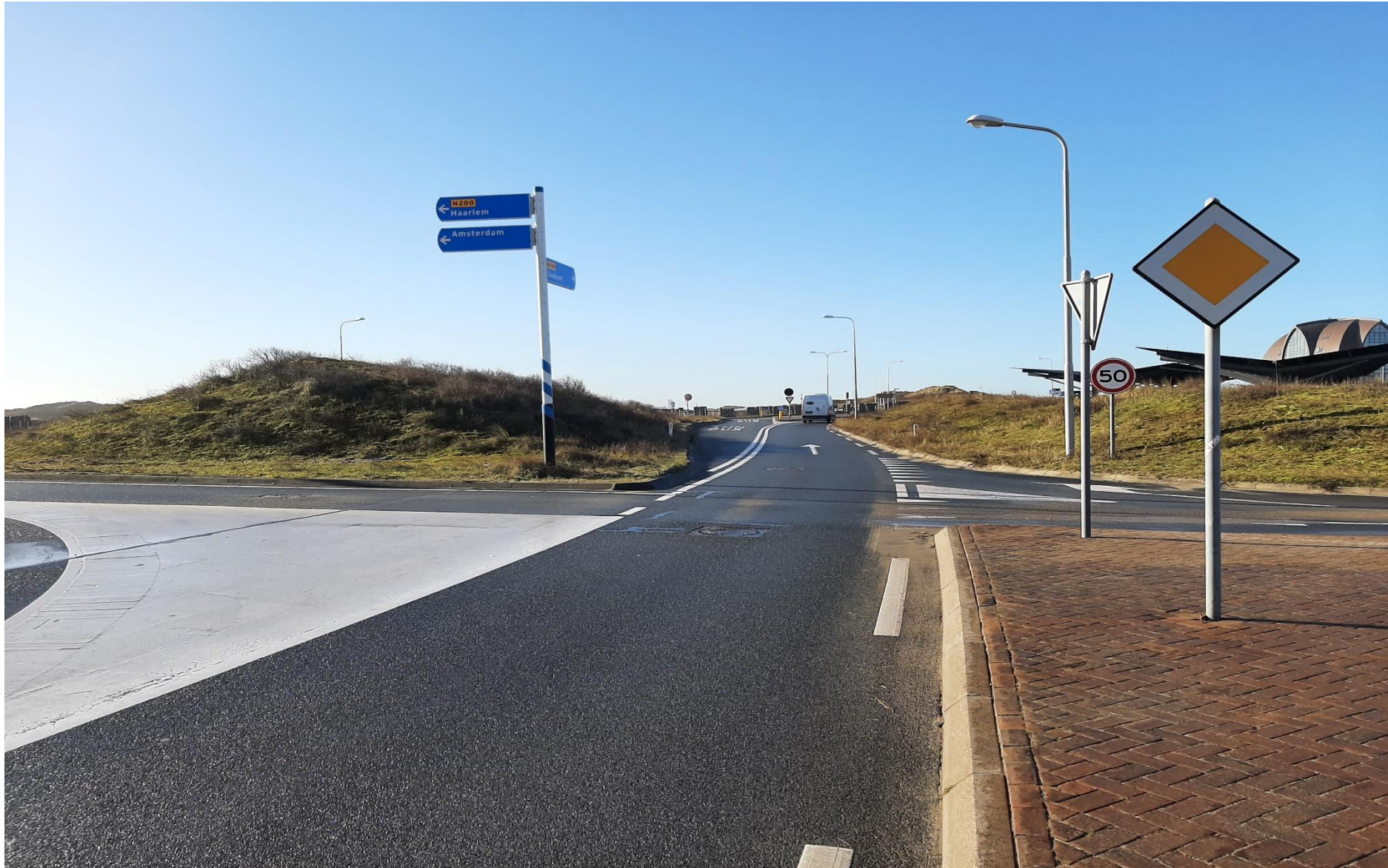
Deze foto is het vervolg op de vorenstaande foto, maar dan richting Zandvoort. Op de voorgrond de doorsteek van de ene naar de andere rijbaan en de afslag naar de grote parkeerplaats aan Zeeweg/begin Parnassiaweg.