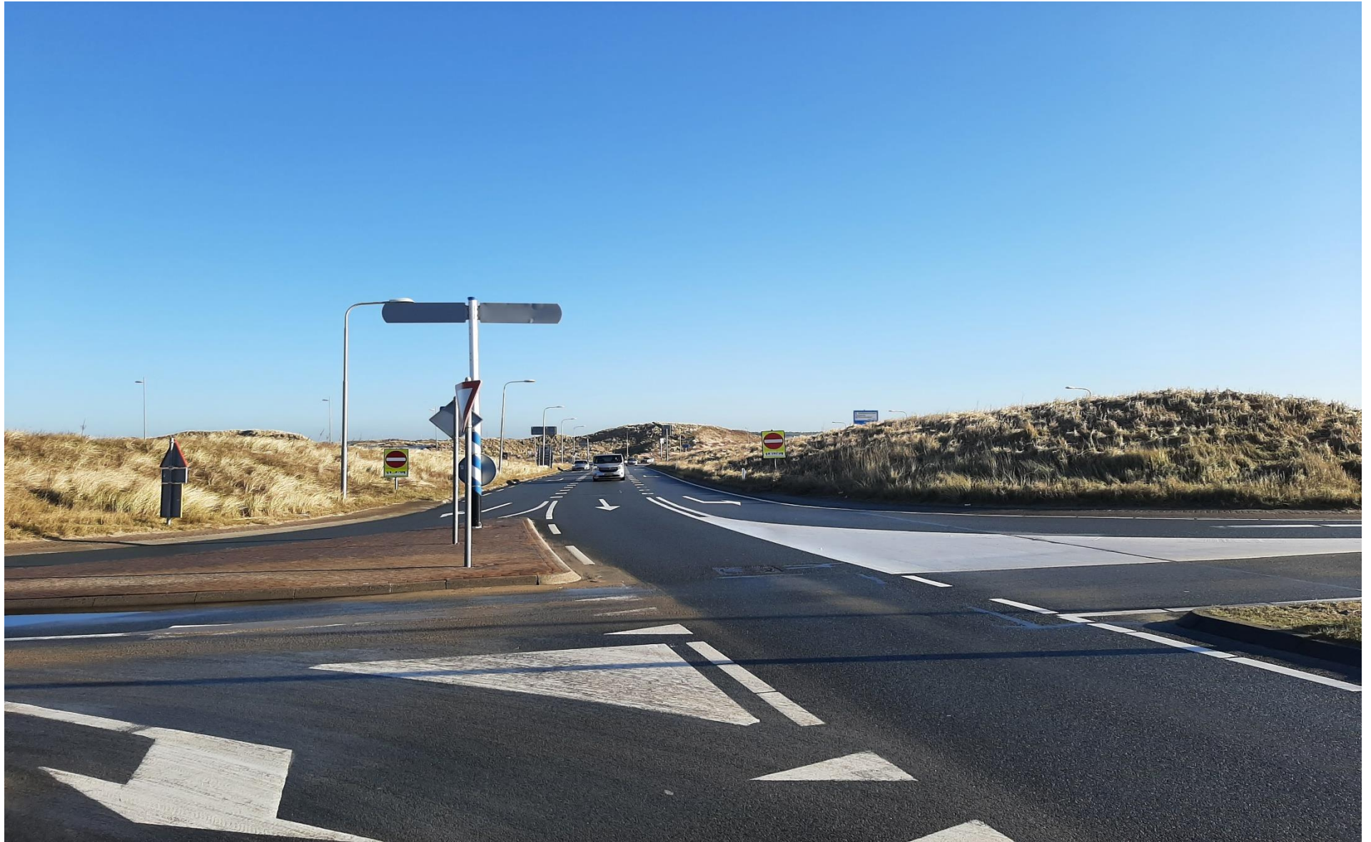
Bovenstaand de hoog en breed aangebrachte bermen tussen de noordelijke rijbaan (bij de ingang van de grote parkeerplaats) en het noordelijke fietspad (links op de foto) en tussen de noordelijke en zuidelijke rijbaan van de Zeeweg (rechts op de foto).