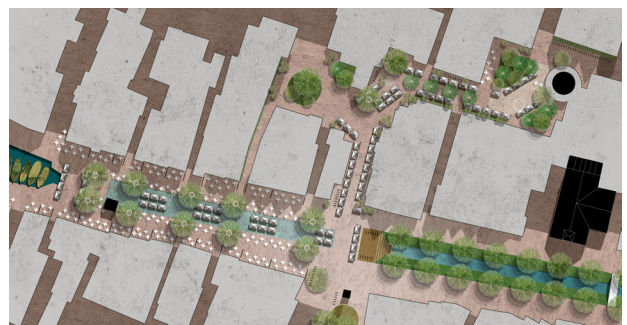
impressie: stedenbouwkundige schetsen door Overlant