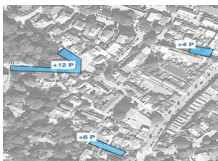
'MINI' Blauwe P-Zones op zijwegen zoals de Koepellaan inzetten als buffer