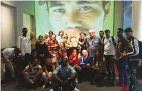
Foto: Bezoekers Nieuwe Wereldhuis in het Volkenkundemuseum in Leiden

De bezoekers van het Nieuwe Wereldhuis gaan regelmatig op stap om kennis op te doen en geïnspireerd te raken. Twee bijzondere excursies in 2017 waren die naar het Frans Hals Museum in Haarlem en het Museum voor Volkenkunde in Leiden. De meeste cursisten waren nog nooit in deze musea geweest.