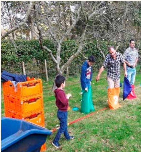
Foto: Syrische en Nederlandse gezinnen doen oudhollandse spelletjes.

Het NZH-Vervoersmuseum stelde twee authentieke bussen beschikbaar om iedereen te vervoeren naar Zebra Zorgboerderij in Vogelenzang. De Syrische en Nederlandse gezinnen deden samen spelletjes. Ook kregen ze 'plukles' voor het maken van appelsap, door van het bedrijf Appel van Opa.