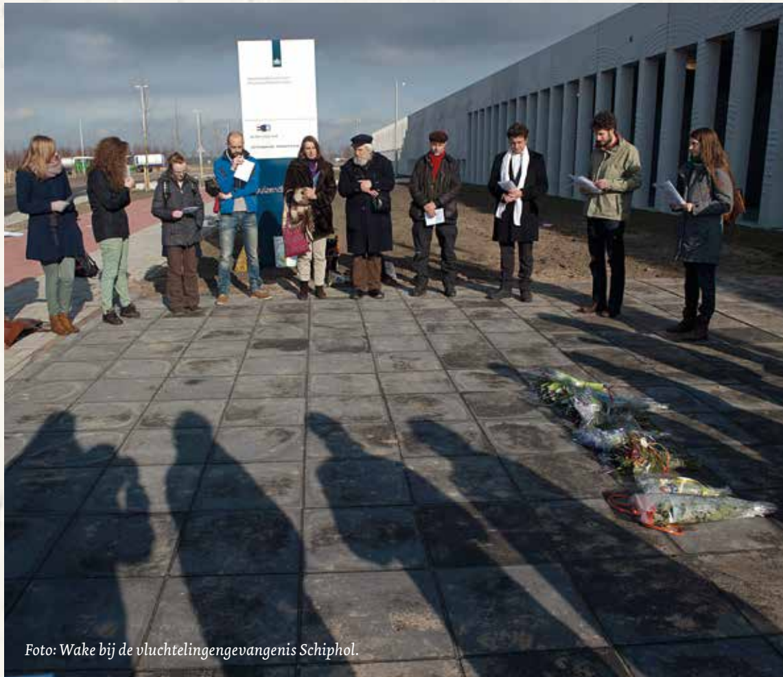
Foto: Wake bij de vluchtelingengevangenis Schiphol.

Stem in de Stad hield ook in 2017 een wake bij de vreemdelingengevangenis Schiphol. Dit is een actie voor mensen die opgesloten zitten, omdat ze niet de juiste papieren hebben. Stem in de Stad wil hen laten weten dat er aan ze gedacht wordt. De deelnemers aan de wake zwaaien naar de gevangenen en zingen en bidden voor ze.