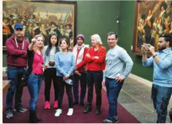
Foto: Bezoekers Nieuwe Wereldhuis in het Frans Hals Museum in Haarlem

In het Museum voor Volkenkunde wordt kunst van verschillende culturen van over de hele wereld tentoongesteld. Sommige deelnemers waren er dan ook trots op als ze iets zagen waar ze, vanuit hun eigen cultuur, iets over konden vertellen aan de groep. De cursisten uit Afrika stonden met 'open mond' voor een grote landkaart van Afrika, omdat ze zich toen pas realiseerden hoe groot Afrika is.