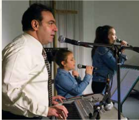
Foto: Zang, dans en samen eten tijdens de Shukran-dag, georganiseerd door Syrische Haarlemmers.

'Shukran!' betekent 'Bedankt!' in het Arabisch. Om iets terug te doen voor de vele behulpzame vrijwilligers hadden ze lange tafels gevuld met zelfgemaakte gerechten. Meer dan honderd volwassenen en kinderen genoten van de maaltijd en muziek. Hiermee lieten de Syriërs weten dat ze de steun van Stem in de Stad zeer waarderen.