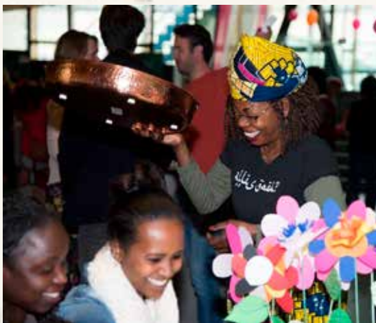
De Wereldkeuken serveert lekkere hapjes bij het Welkom Hier Festival.

Vijf jaar geleden startte het project De Wereldkeuken. Eén keer per maand opende bij Stem in de Stad dit pop-up restaurant, waar vluchtelingen gerechten uit hun landen van herkomst kookten en serveerden. Sinds 2015 is de Wereldkeuken een eigen stichting. In de zomer van 2017 kreeg de Wereldkeuken de kans op een zelfstandige vaste locatie bij debatcentrum de Pletterij. Het project staat op nu eigen benen.