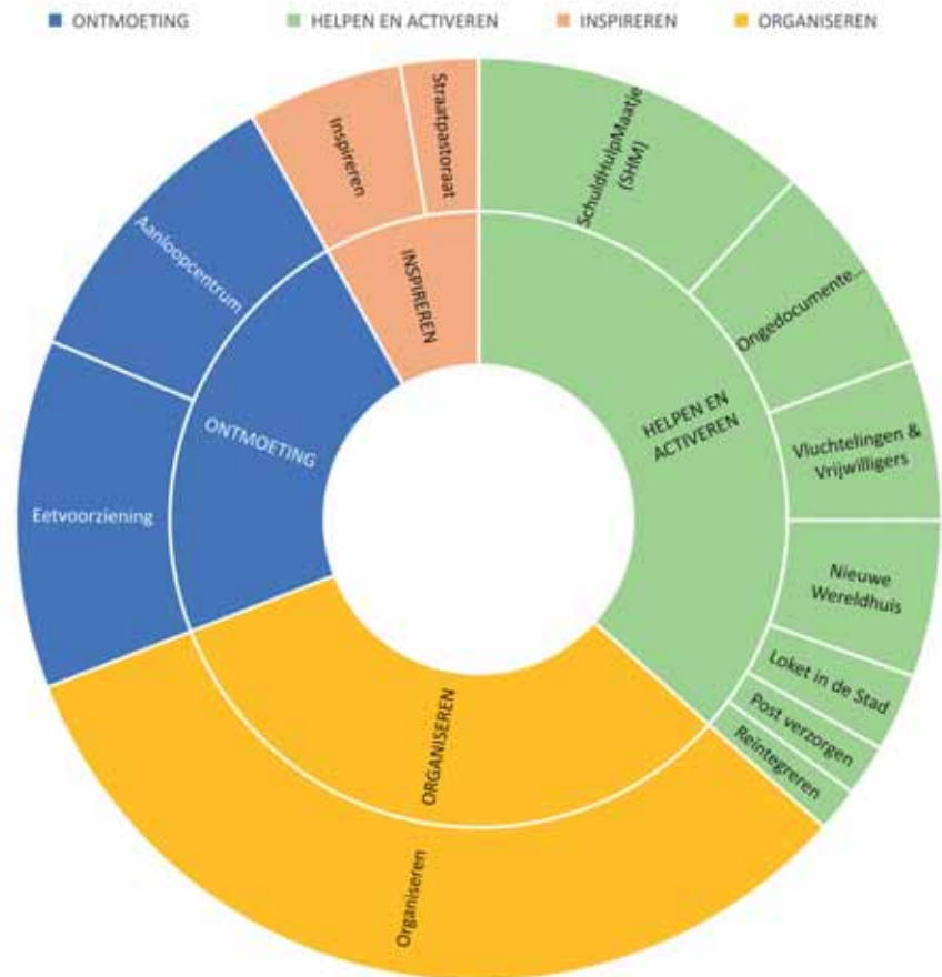
Overzicht kosten per programma 2019

De kosten bedroegen in 2019 € 1.085.700. Voor onze inkomsten zijn we volledig afhankelijk van particulieren, de bijdragen van de Haarlemse kerken, fondsen en de Gemeente Haarlem. Daarnaast dragen ook veel burgers uit Haarlem en omgeving bij met hun kennis die zij voor korte of langere tijd willen inzetten voor onze organisatie. Dat gebeurt op allerlei manie-