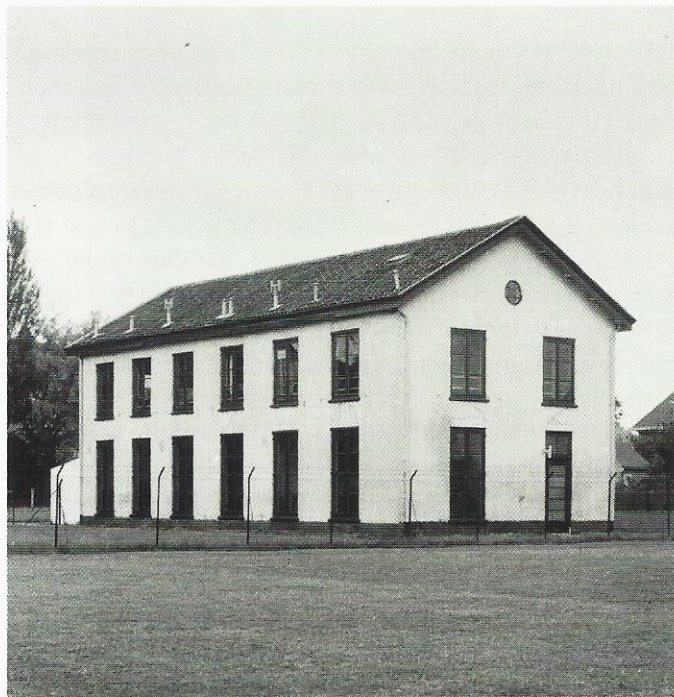
Het Tinholthuis aan de Vrijburglaan in 1953. Oorspronkelijk was dit gebouw een bollenschuur van de familie Roozen. Van 1939 tot 1951 in gebruik als hulpschool van de Koningin Wilhelmina-school. Van 1952 tot 1958 was hier de Tinholt-verzameling te zien. Daarna is het gebouw afgebroken.