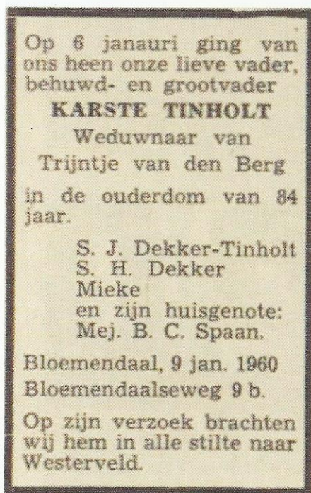
Haarlems Dagblad 11 januari 1960 (NHA)