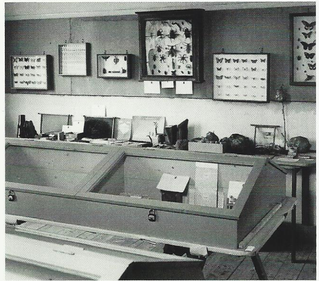
Zaal 2: Insecten, verder 18 vitrines met een algemene verzameling zeeschelpen. Daarnaast o.a. prachtige 'pinna's' (parelmoer schelpen van de Balearen tot 75 cm lengte); paddenstoelen en vissen