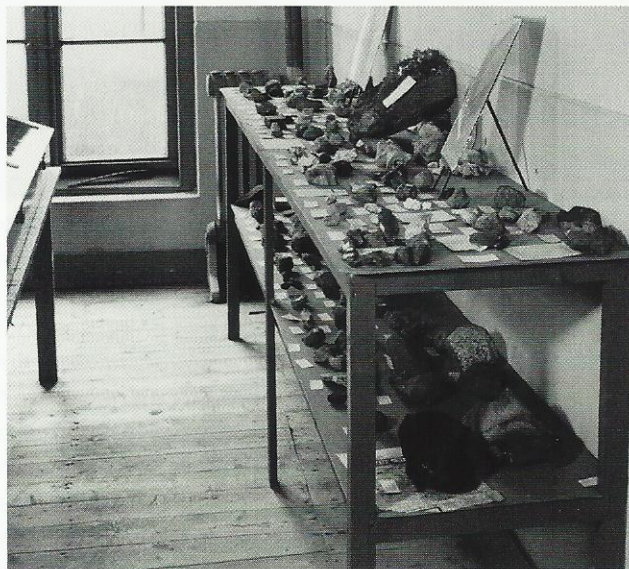
Zaal 3: Een tafel met bijzondere zwerfstenen voornamelijk uit de ijstijden