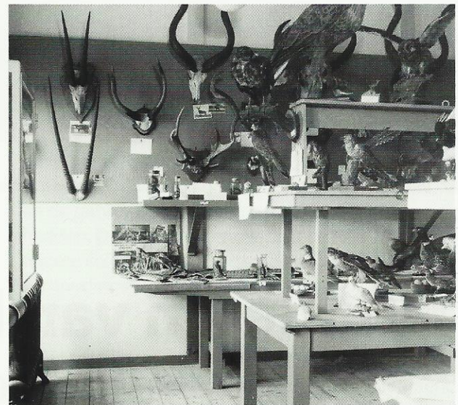
Zaal 5: Geweien, vogels, kruipende dieren o.a. een alligator