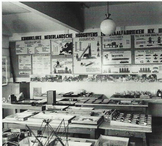
Zaal 6: Beroepen en bedrijven: het Hoogovenbedrijf met grondstoffen