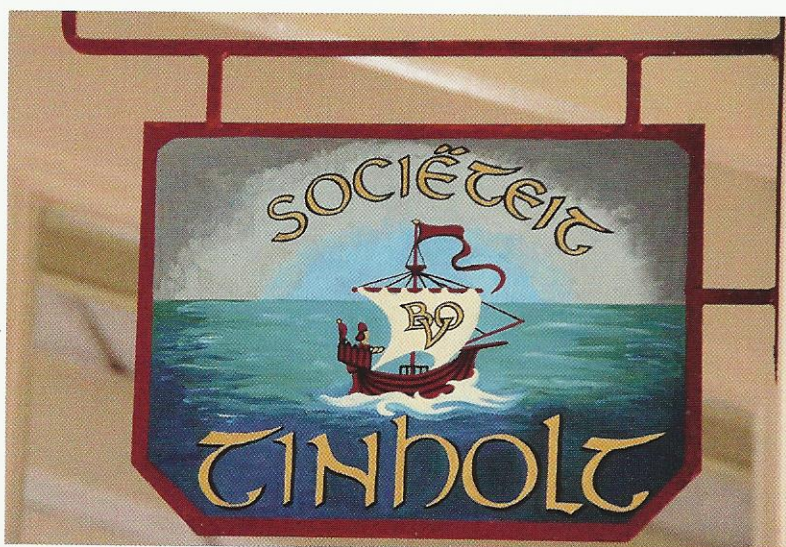
Uithangbord aan het gebouw van de Buurtvereniging Overveen aan de Vrijburglaan.