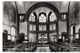
Inwendige van de Kapel in 1954