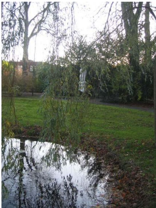
Monumentale bomen, waterpartij en heiligenbeelden