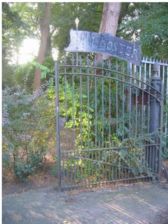
Smeedijzeren inrijhek bij de Schoollaan