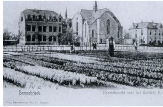
St. Josefkerk, omgeven door de bollenvelden, omstreeks 1905. Rechts van de kerk staat de pastorie, links het (gesloopte) schoolcomplex. Achter de kerk is de dakruiter van het St Luciaklooster zichtbaar.