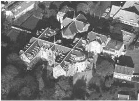
Luchtfoto van het kloostercomplex uit 1954