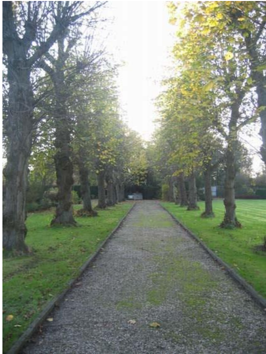
Lindelaantje in de kloostertuin