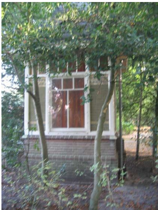
Portiershuisje langs de oprit