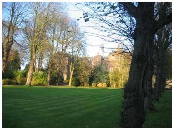
Zicht op het hoofdgebouw vanuit de kloostertuin