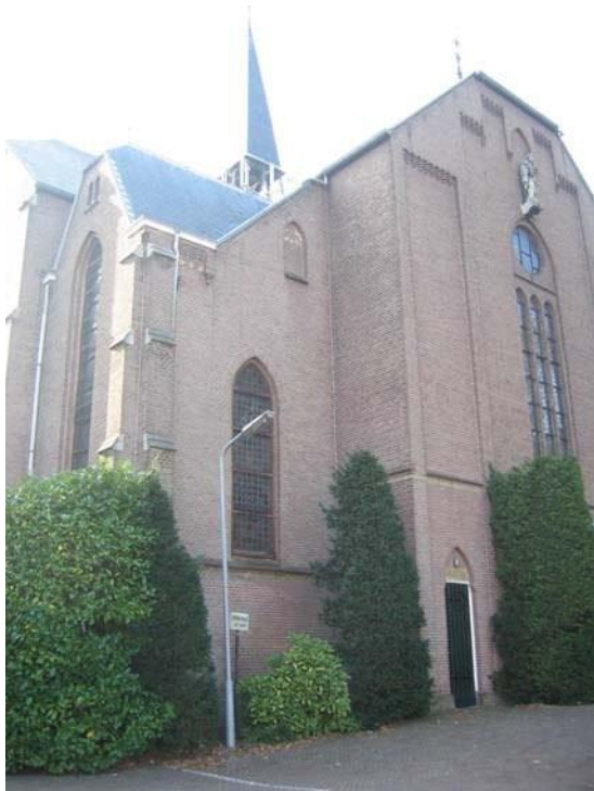
Voorgevel (noordgevel) in de as van de Kerklaan