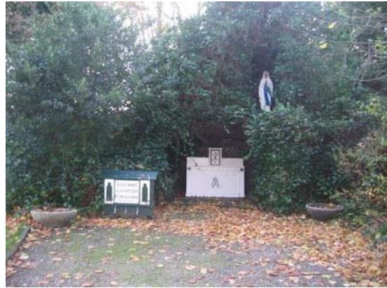
Lourdesgrot met Mariabeeld en neogotische attributen aan het eind van het lindelaantje