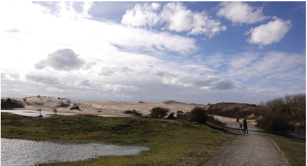
Zandverstuiving bedreigt fietspad naar strandslag Duin & Kruidberg