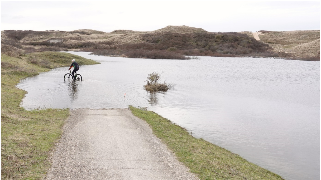
Strandopgang Zeeweg/ Duin & Kruidberg (rechtsboven) is onbereikbaar geworden.