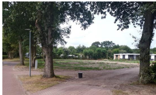
Huidige situatie met aanzienlijk minder beplanting