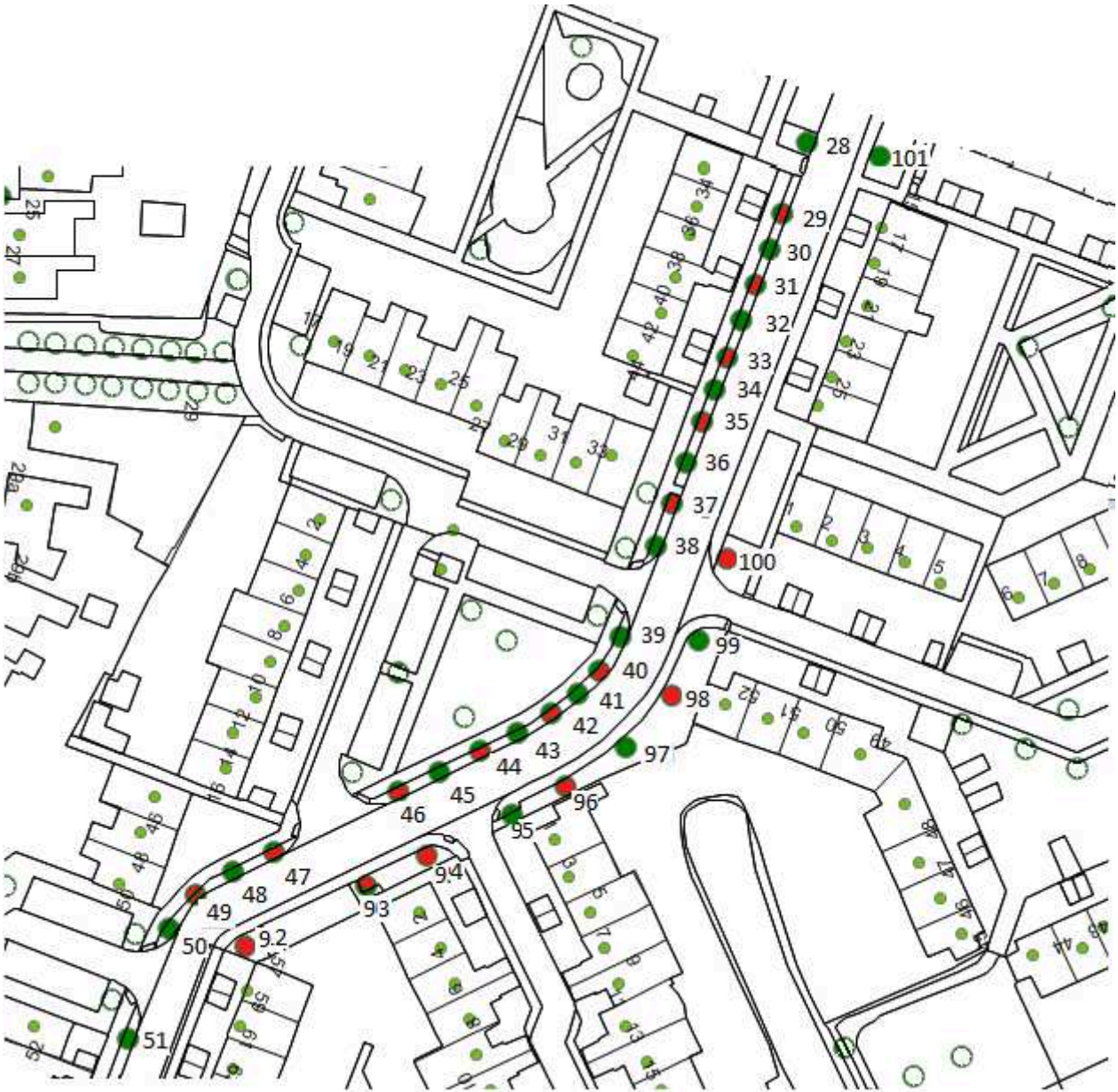
Afbeelding 2. van af de Vogelzangseweg begonnen.