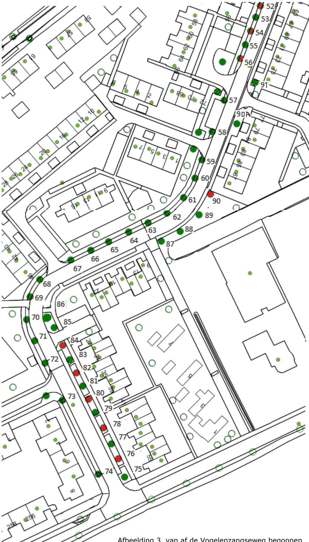
Afbeelding 3. van af de Vogelzangseweg begonnen