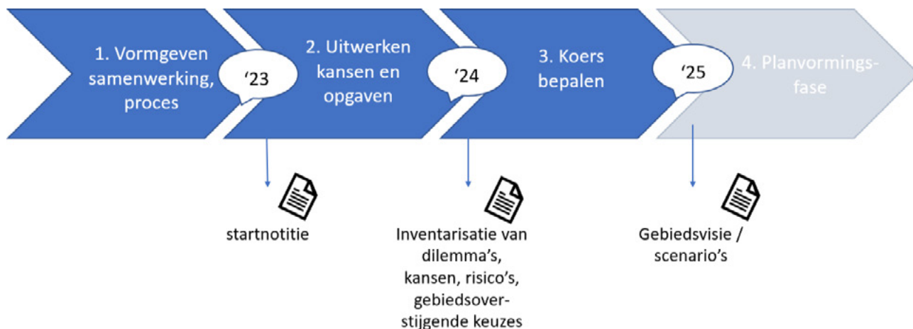
Figuur 2: processtappen verkenningfase Zuid-Kennemerland

Op basis van de brede inventarisatie in de tweede stap is duidelijk wat de bestuurlijke dilemma's zijn die vragen om een koersbepaling in de binnenduinrand, inclusief de termijn en het schaalniveau waarop de keuze gemaakt moet worden. Afhankelijk van de mate van onzekerheden over doelen, kaders en middelen zal bepaald worden of toegewerkt wordt naar een of meerdere gebiedsvisies of gebiedsscenario's. Het uitgangspunt is de behoefte vanuit deelgebieden om tot goede plannen en maatregelen te komen.