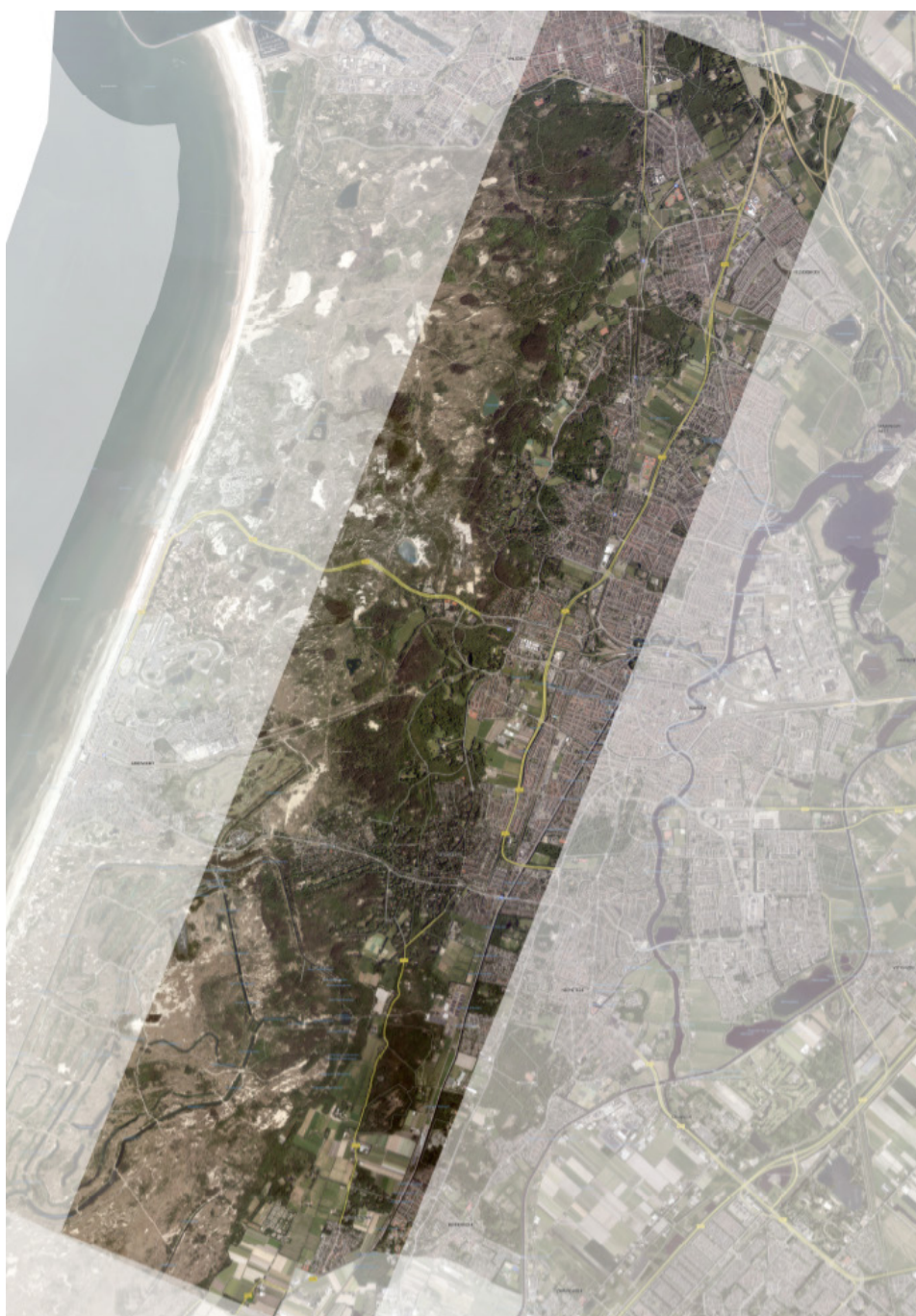
Kaart 1: De binnenduinrand van Zuid-Kennemerland.

In dit document wordt met de binnenduinrand de zone bedoeld die in Zuid-Kennemerland direct tegen het duingebied aanligt, van het Noordzeekanaal tot aan de grens met Zuid-Holland. Hoewel de duinen zelf geen onderdeel zijn van het gebiedsproces, vormt de samenhang van de binnenduinrand met het duinsysteem dat wel. Aan de oostkant is de grens diffuus. In het gebiedsproces kan vanuit elke opgave gezien aanleiding zijn om de grens iets anders te trekken. In het algemeen kan gesteld worden dat de grens gevormd wordt door de samenhang van abiotische systemen (water, ecologie, bodem) en ongeveer ligt bij de overgang naar stedelijk gebied en de overgang naar veengronden.