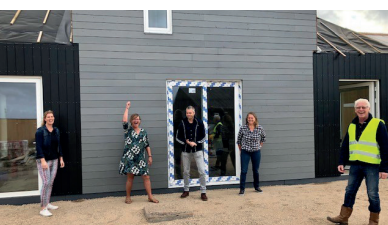
Buurtskap de Tuunen, Texel