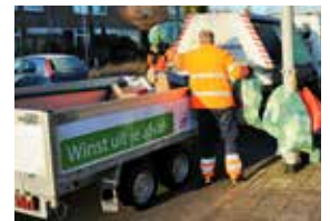
Afvalinzameling kleinschalig materieel.