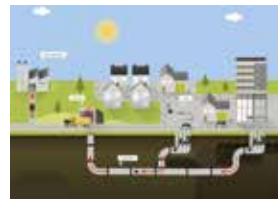
Ondergronds afvalverzamelingsysteem in de Sluisbuurt Amsterdam (OAT).