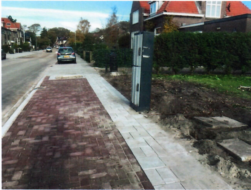
57 cm breedte tussen kast nutsvoorzieningen en grens P-vak