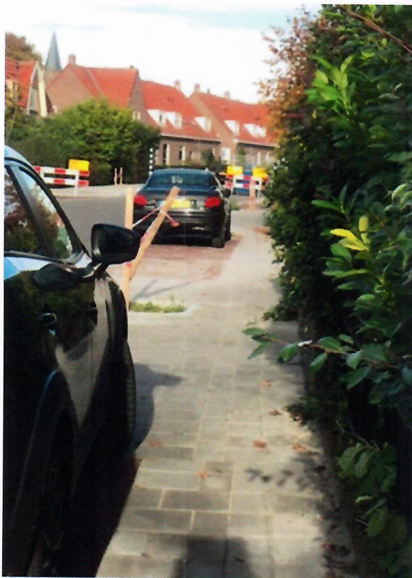
53 cm tussen groen en zijspiegel auto