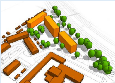
Varianten 1 en 2