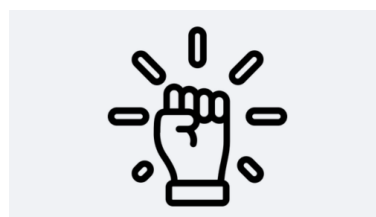
Besluitvaardig en daadkrachtig